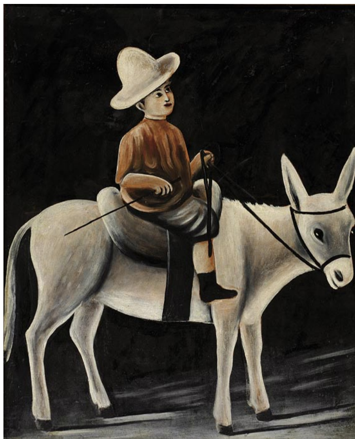
Berniukas ant asiliuko (Gruzijos nacionalinis muziejus)