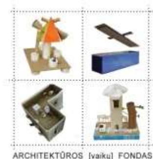
ARCHITEKTŪROS [vaikų] FONDAS