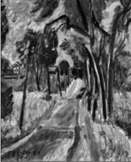
V. Vizgirda. „Kelias pro rugių laukus“. 1955.

Kart., al., 40,5x30,5. Anastazijos ir Antano Tamošaičių galerija „Židinys“