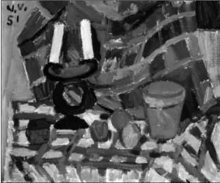
V. Vizgirda. „Natiurmortas“. 1951.

Kart., al., 50,8x60,8. Anastazijos ir Antano Tamošaičių galerija „Židimys“