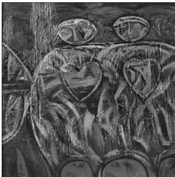
„Dvi figūros“. 2002.

Drobė, aliejus. 105x120. Autoriaus nuosavybė