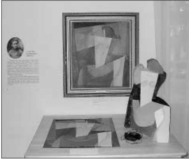
Eimanto Pakalkos ir Rūtos Katiliūtės kūrinys pagal Vytauto Kairiūkščio (1890–1961) paveikslą „Sėdinčios moterys“.