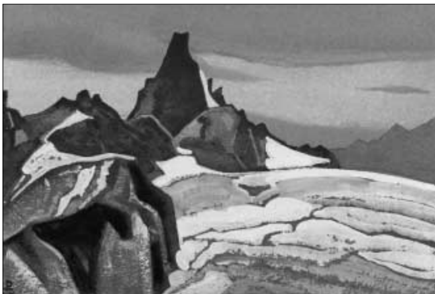
Nikolajus Rerichas. „Himalajai“. 1936.

Kartons, tempera. 30,5x45,5. Latvijas valstybinis dailēs muzejus