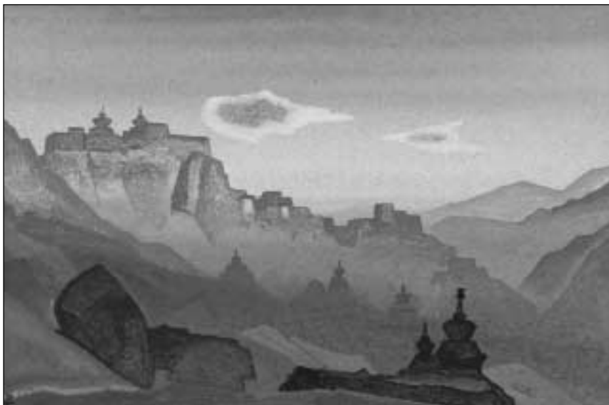
Nikolajus Rerichas. „Ladakchas“. 1937. Kartonas, tempera. 31x46. Latvijas valstybinis dailės muzejus