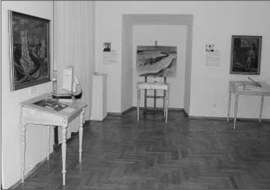
Parodos „Liečiu – matau“, 2004 m. spalio 19 d. – lapkričio 6 d. eksponuotos LDM Radvilų rūmuose, fragmentas