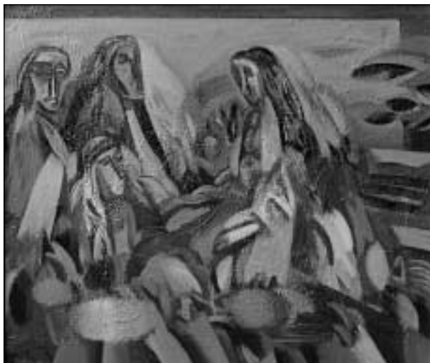
„Neramus pokalbis“. 1998.

Drobė, aliejus. 105x120. Autoriaus nuosavybė