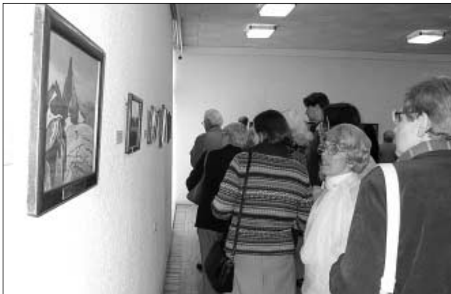
Parodos atidarymo akimirka