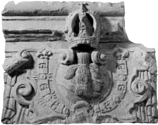
Smiltainio karnizo fragmentas su Vazų dinastijos herbu ir Aukso vilnos ordinu.