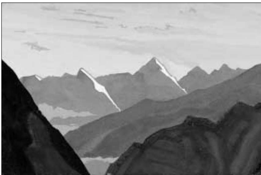
Nikolajus Rerichas. „Rotangas – kalnų perėja“. 1936. Kartonas, tempera. 30,5x45,5. Latvijas valstybinis dailės muzejus