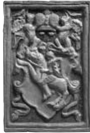
Koklis su Lietuvos Didžiosios Kunigaikštystės herbu.