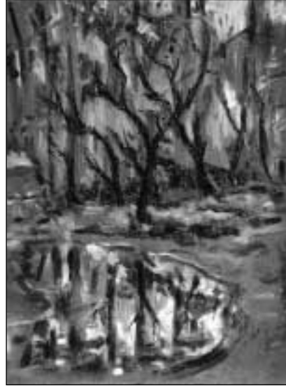
V. Vizgirda. „Peizažas su medžiais“.

Kart., al., 40,5x30,5. Anastazijos ir Antano Tamošaičių galerija „Židinys“