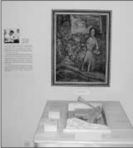
Vygando Vasaičio kūrinys pagal 1934 m. Antano Gudaičio (1904–1989) nutapytą paveikslą „Šv. Mykolas arkangelas. Natiurmortas su skulptūrėlė“. Drobė, aliejus, 80,5x60. LDM