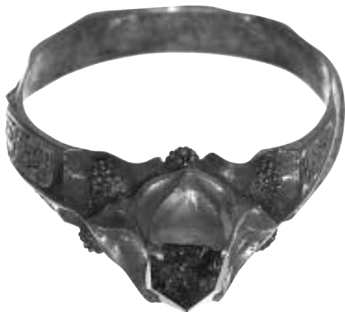
Auksinis žiedas su deimanto akute.

XVI a.