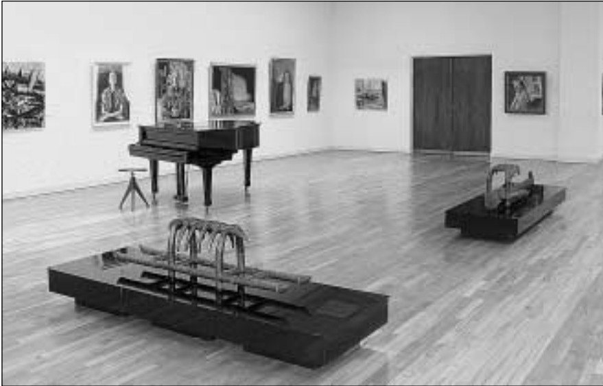
Parodos „Trys Klaipėdos dailės dešimtmečiai“ fragmentas. 2005 m. birželio mėn.

tūros, grafikos, taikomosios dailės kūrinių. Paroda užima keturias Prano Domšaičio galerijos sales pirmajame ir antrajame galerijos aukštuose. Erdvioje pirmojo aukšto salėje, iš kurios atsiveria gražūs galerijos vidinių kiemelių vaizdai, eksponuojamos skulptūros, piešiniai. Greta – dvi grafikai skirtos salės. Antrojo aukšto salėje eksponuojama tapyba.