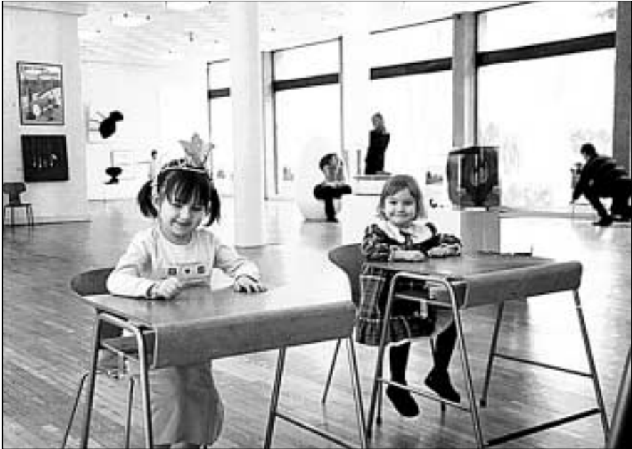
Parodos „Mažasis Arnė“ edukaciniuose užsiėmimuose mažiesiems muziejaus lankytojams buvo įdomu

Didžioji dalis parodos „Mažasis Arnė“ eksponatų buvo skirti ne tik pasižiūrėti. Juos buvo galima išbandyti – atsisėsti, paliesti. Tai ypač sudomino vaikus ir jų tėvelius, pedagogus, kurie gausiai lankė parodą.