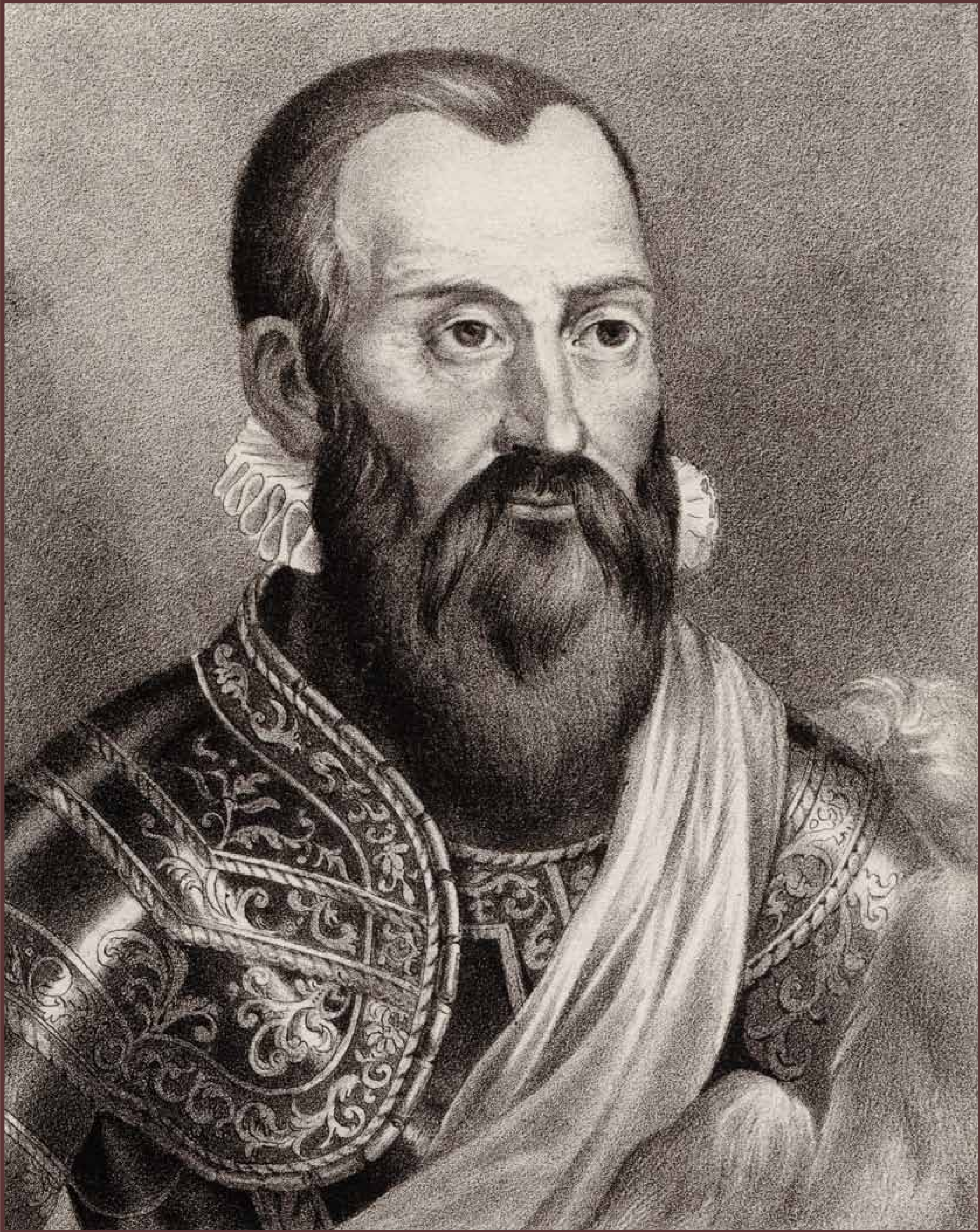
Nežinomas XIX a. dailininkas Mikalojus Radvila Juodasis Lietuvos dailės muziejus

Apie penkiolika metų (iki mirties) trukęs M. Radvilos Juodojo protestantiškas gyvenimas pakeitė Lietuvos kultūros ir krikščioniško sąmoningumo padėtį. Tiesa, paties M. Radvilos Juodojo vaikai perėjo į katalikybę ir tapo uolūs Katalikų Bažnyčios rėmėjai. M. Radvilos Juodojo, kaip ryškios asmenybės, svarbą Lietuvos istorijai