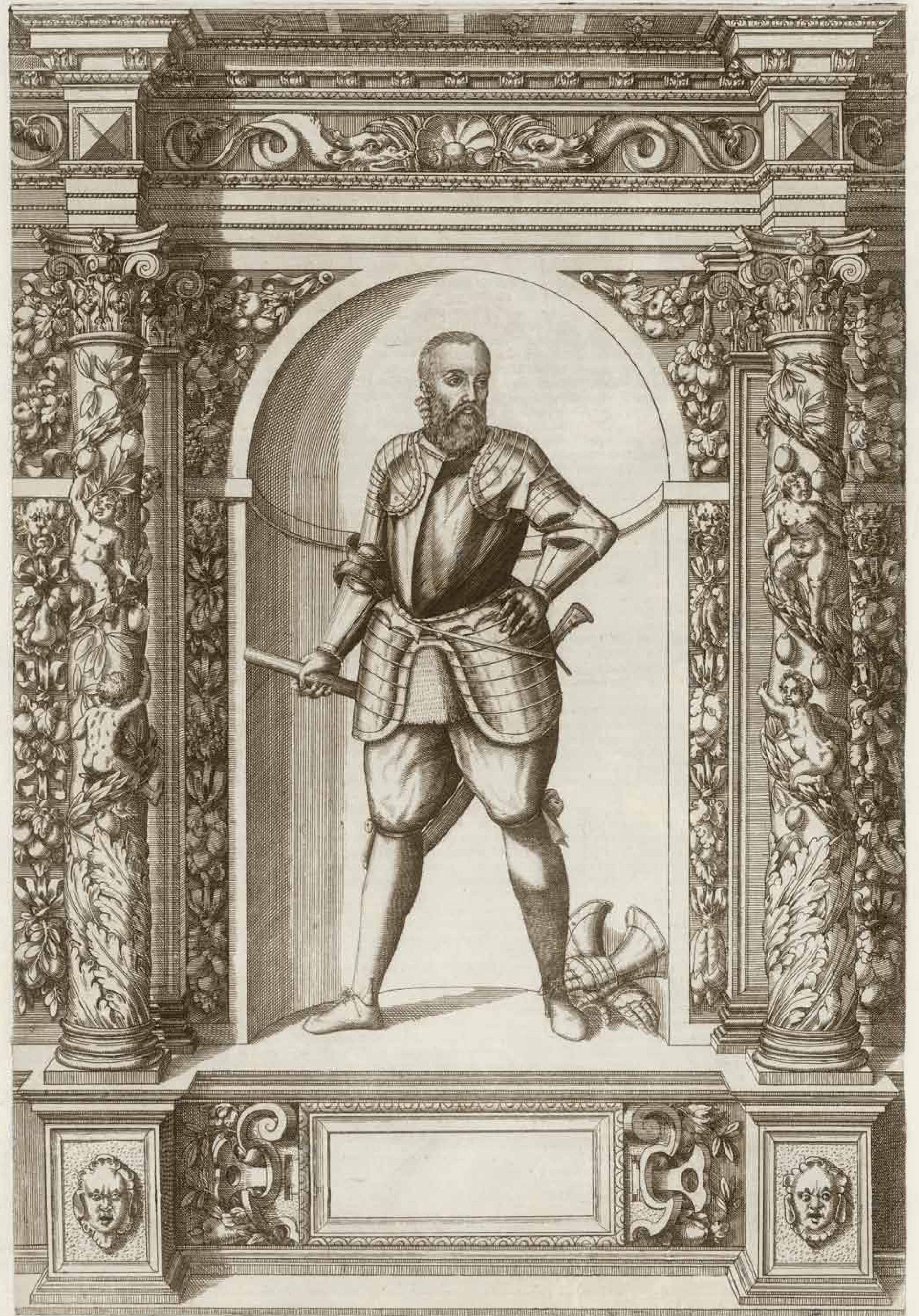
Mikalojaus Radvilos Juodojo portretas Iš Jacobo Schrencko von Notzingo knygos Der Aller Durchleuchtigsten und Grossmächtesten Kayser... wahrhaffige Bildmussen... , Innsbrukas, 1603 Nacionalinis muziejus Lietuvos Didžiosios Kunigaikštystės valdovų rūmai

valstybės, tiek nuo Lenkijos karalystės. Aktyviai skleidė protestantizmo idėjas – savo valdose kunigus katalikus pakeitė protestantais, Vilniuje fundavo evangelikų reformatų bažnyčią, o Lietuvos Brastoje įsteigė protestantiškų raštų spaustuvę. Manė, kad Reformacija valstybei bus naudinga: suvalstybintos bažnytinės žemės padidins išdo pajamas, o protestantų bažnyčia, priklausanti nuo valdovo pasauliečio, stiprins Lietuvos valstybingumą.