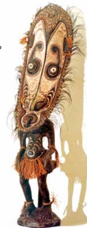
Protėvis. Naujoji Gvinėja. XX a.

Informacija tel. (8 5) 212 14 77 www.ldm.lt , www.muziejai.lt