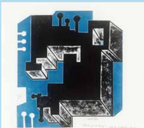
V. Kisarauskas Kompozicija.1967

Informacija tel. (8 5) 219 59 60 www.ndg.lt , www.ldm.lt , www.muziejai.lt